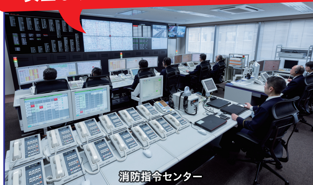
消防指令センター